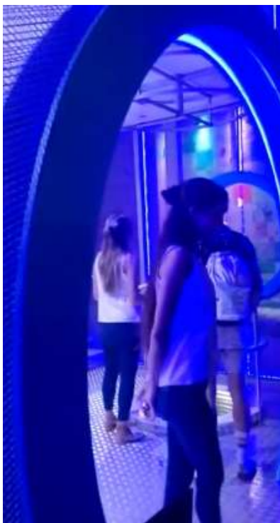
Promotoras en el “ Lollapalooza Argentina ” vestidas con los colores de la marca Marlboro Ice Blast , San Isidro, 31 de marzo 2019

Tal como se comprobó, la edición Marlboro Mega Blast se puede ver en el sitio web de la marca promocionado. Los cigarrillos saborizados con cápsula se encuentran a un precio muy similar al de los cigarrillos tradicionales.