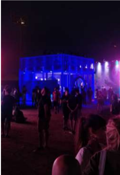
Stand de la marca Malboro, " Lollapalooza Argentina ", San Isidro, 31 de marzo 2019