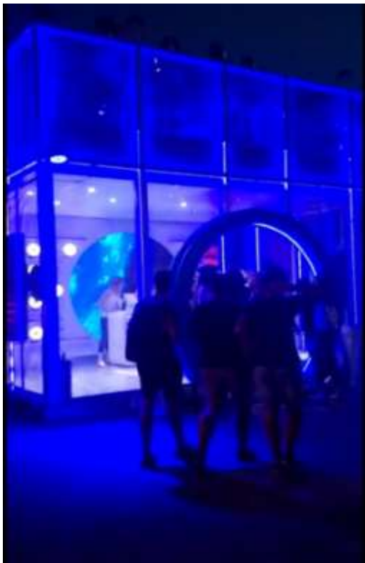
Stand de la marca Malboro, " Lollapalooza Argentina ", San Isidro, 31 de marzo 2019

Stand de la marca Malboro, " Lollapalooza Argentina ", donde, al fondo de la imagen, se pueden apreciar la exhibición del producto desde el exterior del local. San Isidro, 31 de marzo 2019