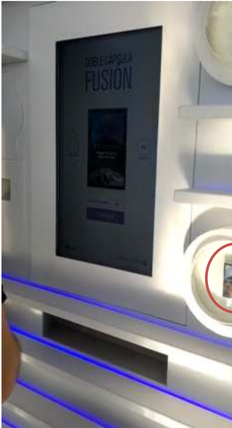
Secuencia Nro. 4

Máquina expendedora en el Stand y de la marca Malboro, "Lollapalooza Argentina", San Isidro, 31 de marzo 2019.