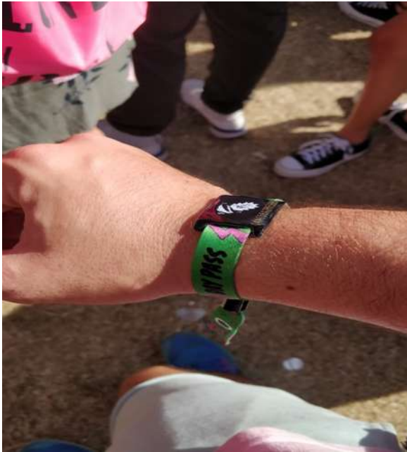
Ticket promocional en “ Lollapalooza Argentina ”, San Isidro, día 3, San Isidro, 31 de marzo 2019

Durante los días 29 y 31 de marzo de 2019, FIC Argentina desarrolló un monitoreo del Festival “ Lollapalooza Argentina ” realizado en la Ciudad de San Isidro, Provincia de Buenos Aires. Para ello se asistió, durante las fechas mencionadas al espectáculo de música, realizado en el Hipódromo de la ciudad mencionada, ubicado en Av. Márquez 700, Provincia de Buenos Aires.