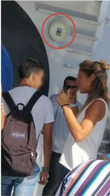
Promotoras en el “ Lollapalooza Argentina ” vestidas con los colores de la marca Marlboro Ice Blast y exhibición de productos, vistos desde afuera del local, San Isidro, 31 de marzo 2019