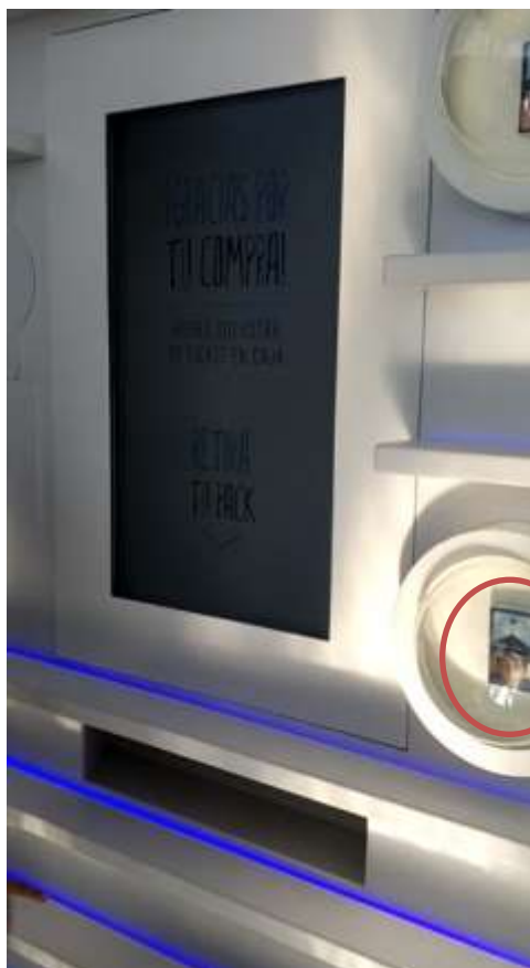
Secuencia Nro. 5

Máquina expendedora en el Stand y de la marca Malboro, "Lollapalooza Argentina", San Isidro, 31 de marzo 2019.